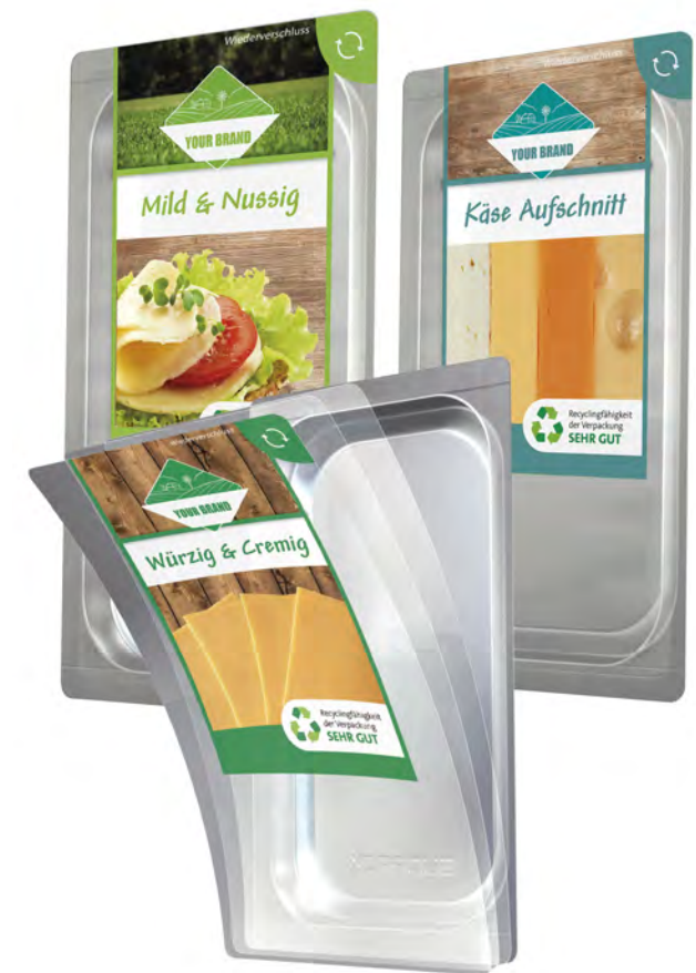
Aufschnittkäse in Multi Peel Verpackungen

Technisch gesehen dominieren drei bekannte Wiederverschlussysteme das Geschehen im europäischen Markt für Käse- und Wurstwaren: Snap on Lid-Systeme, Wiederverschlussketten